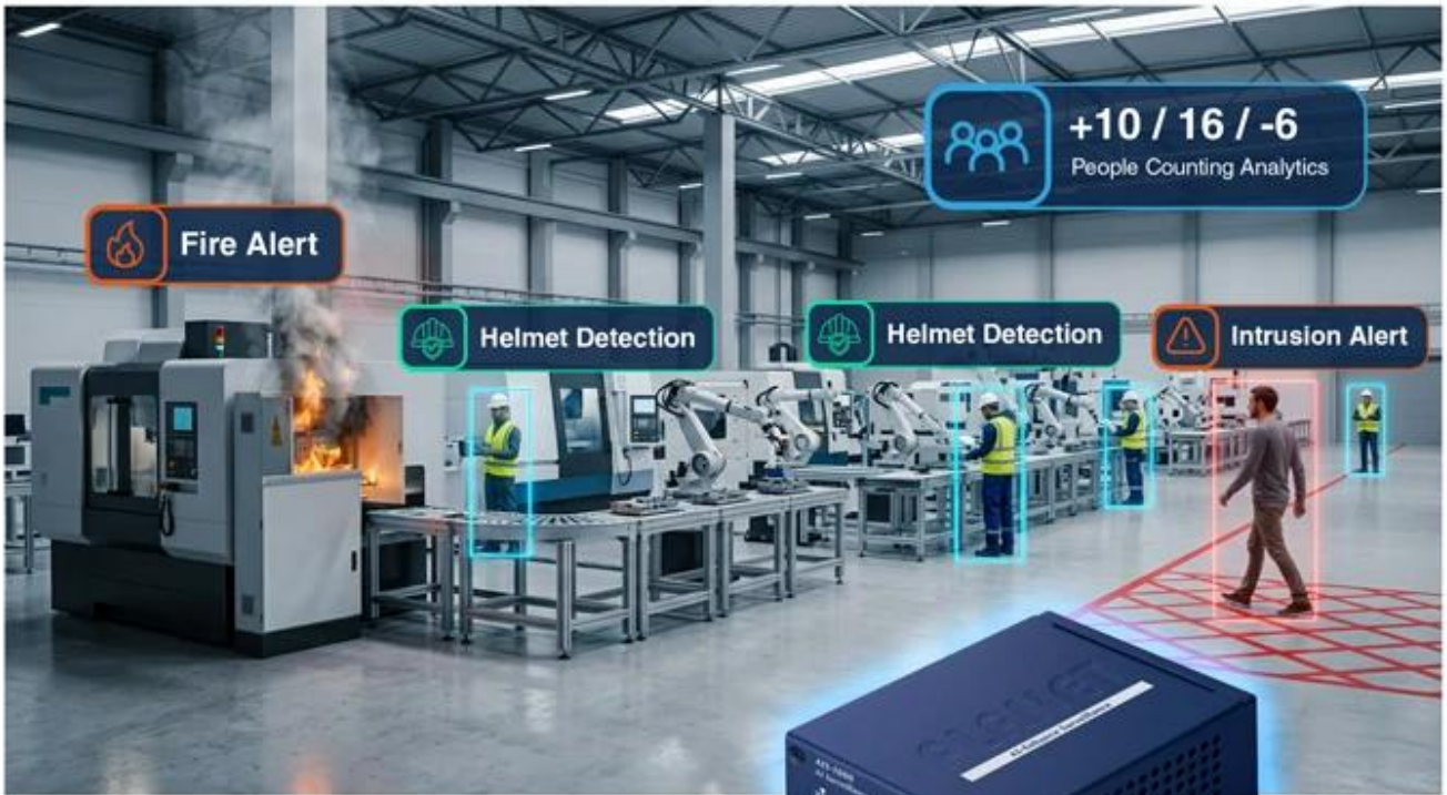
AI Surveillance Station AIS-1000