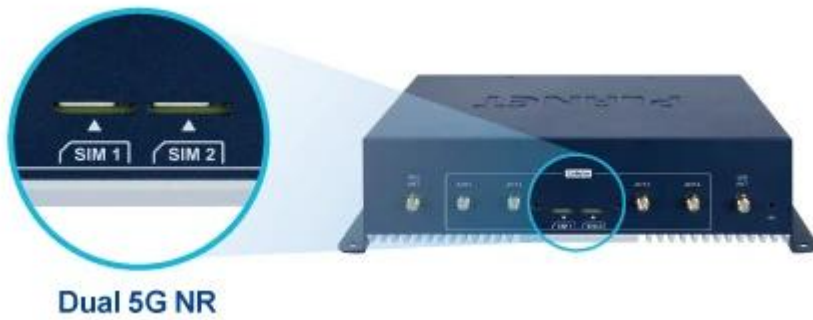
Dual 5G NR