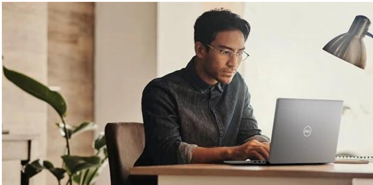
Dell Latitude 7450

Tento notebook disponuje anglickým (UK) rozložením klávesnice.