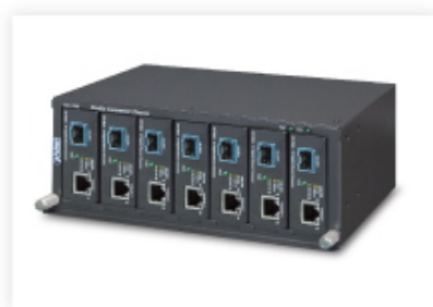
Media Chassis Installation