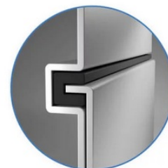
Sealed Lock-and-Key Design

Na zadní straně je k dispozici celá řada portů, mezi nimiž vyčnívá především rozhraní HDMI 2.0 , které zajistí snadné promítání 4K obsahu při vyšším jasu a kontrastu oproti standardnímu rozlišení. Jas je klíčem k viditelnosti. I proto nabízí projektor BenQ LU9245 funkci dynamického tlumení jasu dle scény a optimalizuje světelný výkon a kontrast pro co nejlepší obraz.