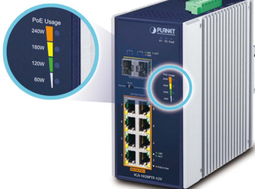
PoE Power Usage Display

ČSN EN 61000-4-11:2004 - Krátkodobé poklesy napětí, krátká přerušení a pomalé změny napětí