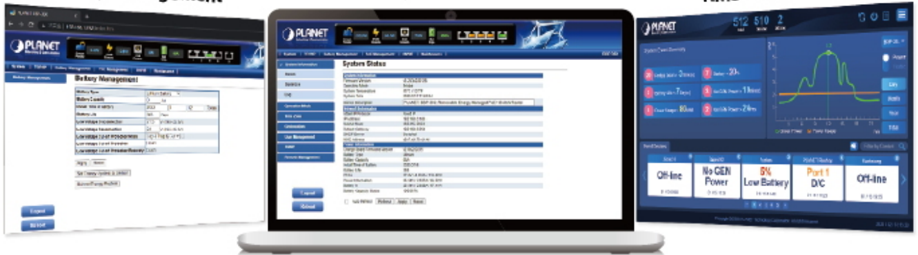
NMS-360 Web GUI